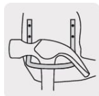
Gancho de acero para martillo